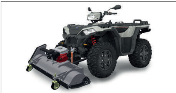
FRONTSCHLEGELMÄHER FM100 RYKOV

Marke: Rykov Breite: 1000 mm Motorleistung: 9 HP, Honda GX-270 Modell: FM 100 Preis: Fr. 3'390.- MwSt. inkl. Montage Halterung: Fr. 100.- MwSt. inkl.