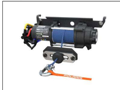
SEILWINDE PRO HD 4'500 LB [#2882711]