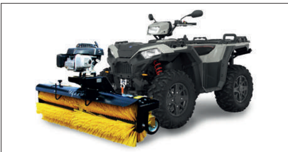
KEHRMASCHINE MK 130 PROFI RYKOV

Art. N. RY - 1650-00.000 RY - 1017-00.000