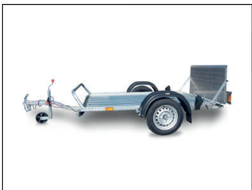
CRESCI PT4 S.F.