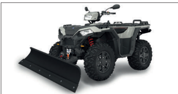
SCHNEESCHILDER ATV 150 RYKOV

Marke: Rykov Breite: 1500 mm Modell: ATV 150 Preis: Fr. 590.- MwSt. inkl. Montage Halterung: Fr. 100.- MwSt. inkl.