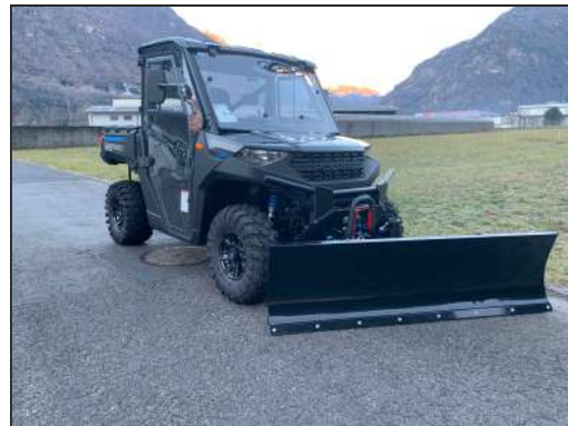
SCHNEESCHILD-KIT RANGER 1000