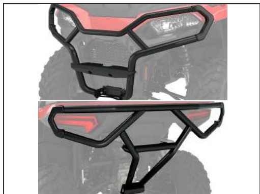
BUMPER VOR/HIN [#2884844/#2884847]