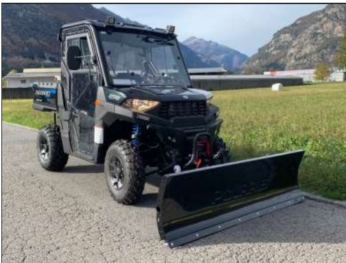
SCHNEESCHILD-KIT RANGER 570