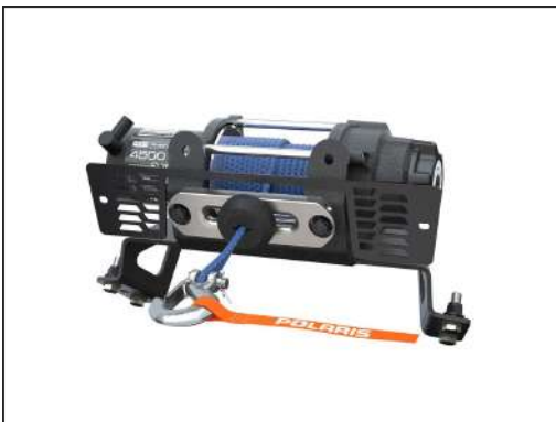
SEILWINDE PRO HD 4'500 LB [#2882238]