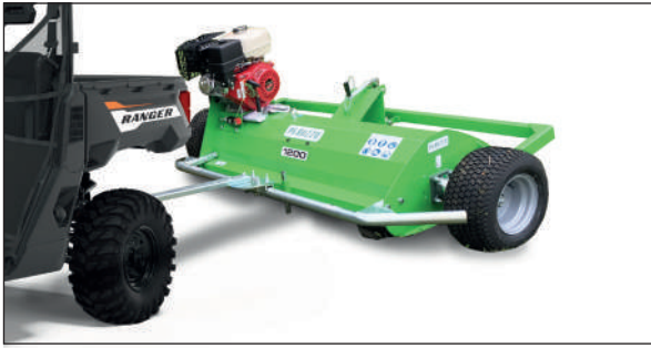
HECKSCHLEGELMÄHER MOTOFOX PERUZZO

Marke: Peruzzo Breite: 1200 mm Motorleistung: 13/18 HP, Briggs & Stratton Modell: Moto Fox Preis: ab Fr. 4'423.- MwSt. inkl.