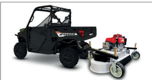
HECKMÄHWERKE FD 120 RYKOV

Art. N. RY - 1325-00.000 RY - 1017-00.000