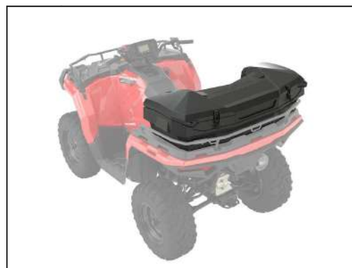
CARGO BOX HINTEN [#2884853]